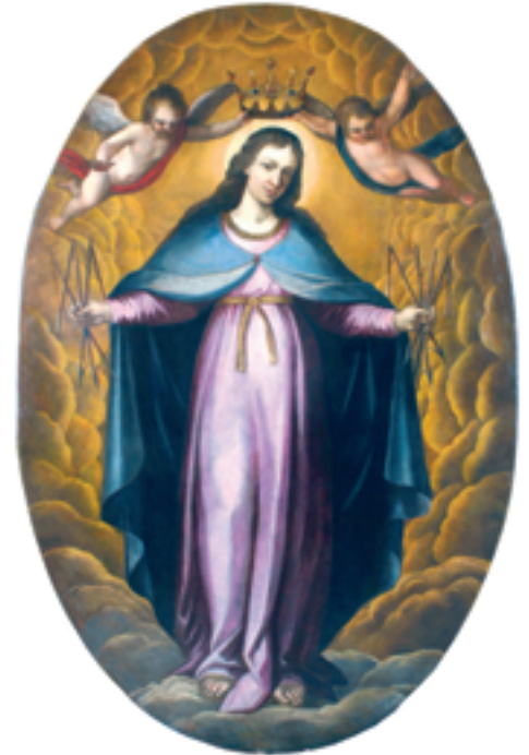
Zwyciężyłaś – Zwyciężaj!

M: To prawda. Jednak Matka Boża jest z nami, jest obecna, swoje wezwanie kieruje do nas, mówi nam, abyśmy dawali przykład, byśmy byli odbiciem, abyśmy swoim życiem dawali nadzieję i świadectwo.