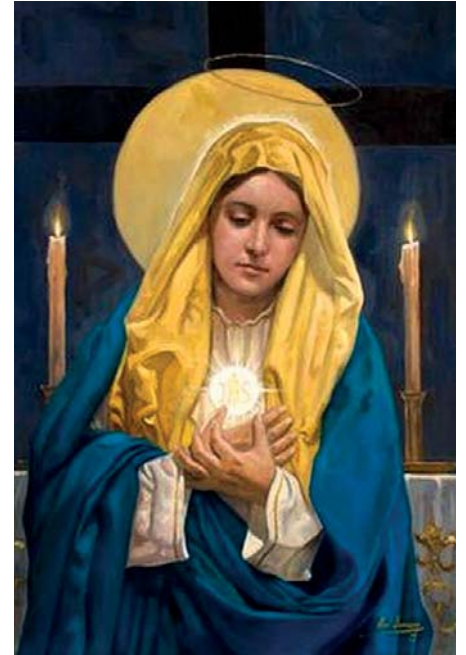
Bóg to Pokój w ludzkim sercu

Pius X określił modernizm jako sumę wszystkich herezji. Modernizm jest ściśle związany z masonerią, której głównym celem jest walka z Kościołem poprzez szerzenie demoralizacji