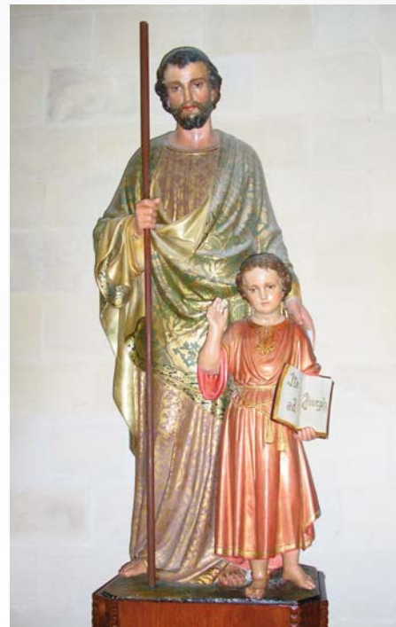
Opiekunie Kościoła Świętego

Teraz każdy z nas może upodobnić się do Chrystusa, w każdym z nas Bóg Ojciec może rozpoznać prawdziwe dziecko Boże, w Jezusie, Jego Synu Jednorodzonem. Ta rzeczywistość, niewiarygodna dla Żydów, jest dostępna dla każdego człowieka. Mamy wszystko, abyśmy mogli nią żyć; mamy Sakramenty, aby tę rzeczywistość zaszczepić w naszym życiu, aby ją odzyskać, jeśli zostaliśmy jej pozbawieni przez grzech. Mamy Maryję, która kocha nas i wzywa nas, abyśmy w Bogu znaleźli swój pokój i radość życia.