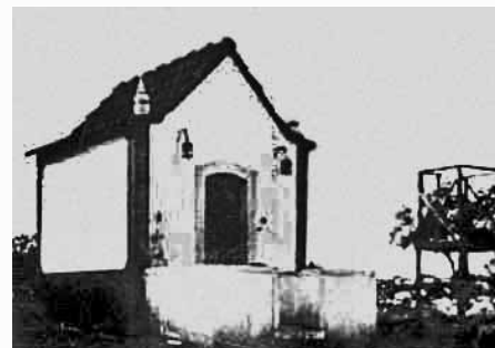
Pierwsza kapliczka wybudowana dokładnie w miejscu objawienia się Matki Bożej w Fatimie.

Niech każdy z nas posłucha Jej wezwania, rozpozna je i powie: To jest czas łaski dla mojej duszy , Maryjo, i pragnę go wykorzystać, wznosząc moją duszę ku Tobie i ku Jezusowi, aby zaczerpnąć z Twego Niepokalane-