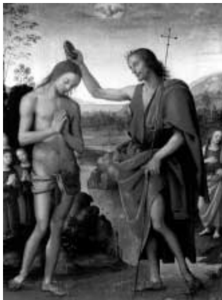
Oto Syn Mój Umilowany

Błogosławiona Dziewica Maryja zrodziła dla nas Jezusa. Prowadzi nas do Niego. Jego nam daruje z pragnieniem i z prośbą byśmy przyjęli Go tak jak Ona. Gdy nadeszła pełnia czasu, Bóg Ojciec w swej odwiecznej miłości i mądrości zbliżył się do Maryi przez archanioła Gabriela, prosząc Ją aby zechciała być Matką Jego Syna Jezusa. Bóg nie zmusza Jej lecz zachęca, oferuje zbawienie nie narzucając go. Maryja powiedziała „ Tak ” w imieniu ludzkości, w imieniu wszystkich pokoleń, w imieniu każdego z nas. Jej „ Tak ” niczym echo słyhać do dziś. W sercu i w łonie Maryi było miejsce dla Boga. Bóg zniżył się ku swojemu stworzeniu – Maryi oczekując od Niej współpracy w swoim planie zbawienia człowieka. Bóg nie chciał pozostać jedynie Bogiem. Stał się również człowiekiem. Stwórca zapragnął stać się swoim stworzeniem. W ten sposób pokazał wartość człowieka i jego gotowość przyjęcia Zbawiciela. Nieznane i niezbadane są drogi Bożej miłości dla człowieka. Bóg pozostaje maluczki, nieznaczny odda-