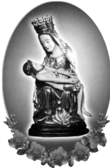
Gdy nie widzicie sensu życia weźcie różaniec

Treść Jej orędzi jest zawsze taka sama, a nowością w nich jest to, że do nas mówi dzisiaj, teraz, w obecnym czasie. Nie możemy zatrzymywać się tylko na słowach, ale potrzeba abyśmy weszli w głębię tych słów, aż do rdzenia macierzyńskiego serca, z których one pochodzą. Nie zatrzymujemy się przy drogowskazie, ale idźmy tam